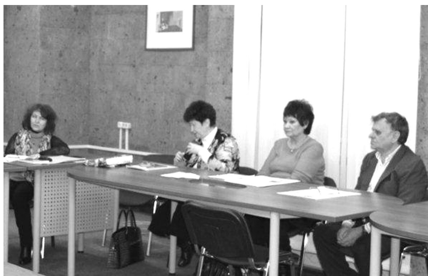
Занятия в кандидатской группе поэзии