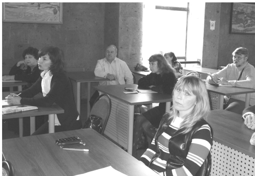
Занятия в кандидатской группе прозы